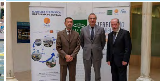
II Jornada de Logística Portuaria de Sevilla.