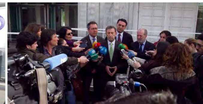
Inauguración de la nueva Terminal de Cruceros del Muelle de las Delicias.