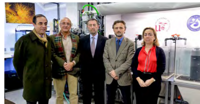
Presentación de los laboratorios para el conocimiento del estuario del Guadalquivir.