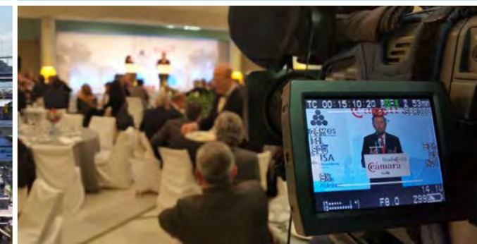
Almuerzo-coloquio en la Cámara de Comercio de Sevilla.