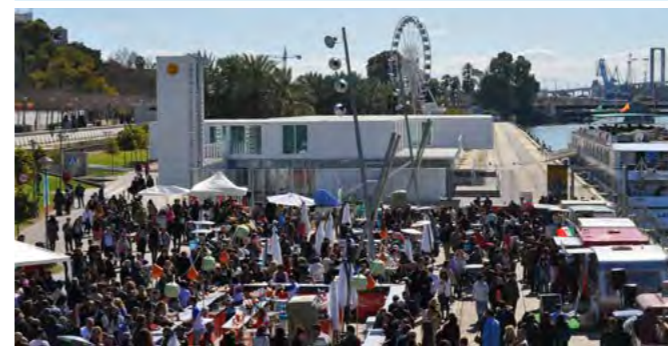
Mercado gastronómico 'Callejeando Food Fest'.